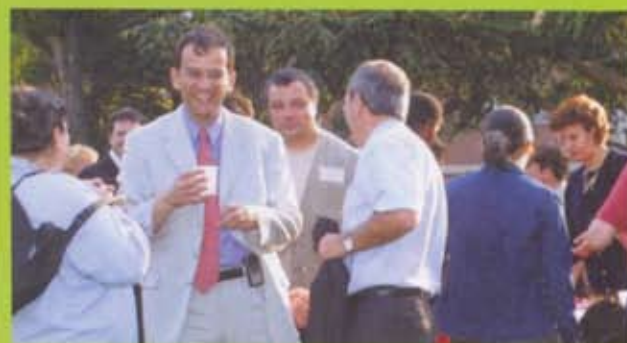
Apéritif à La Plaine dans une ambiance conviviale

Le 27 mai dernier se tenait à Clamart la première édition des Immeubles en fête. Ce grand rendez-vous de la convivialité, surnommé par certains "la fête des voisins" avait comme objectif de développer la solidarité de quartier. Ce fut un succès !